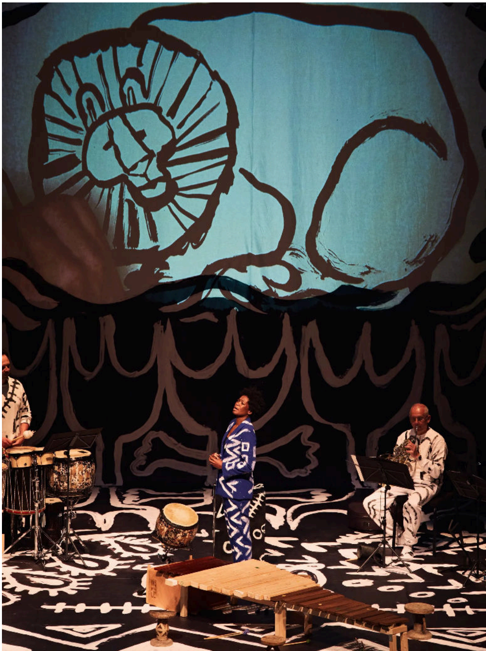
Scène uit de voorstelling Babar en het ontstaan van de wereld .